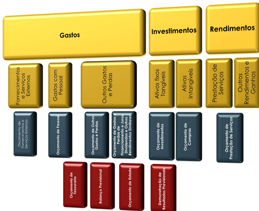
Ilustração 2 - Estrutura do orçamento